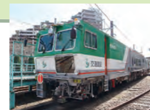
マルチプルタイタンバ

実習線には線路、分岐器、踏切など様々な実習を行える設備があります。また、線路保守に欠かせない大型機械や重機も配置しています。