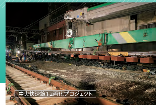
中央快速線12両化プロジェクト

お客様が快適に目的地へ到着できるよう、数ミリのズレも許されない精度でつくられた線路が安全輸送を実現させます。