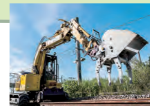
B4 (バックホウ+4頭タイタンバ)