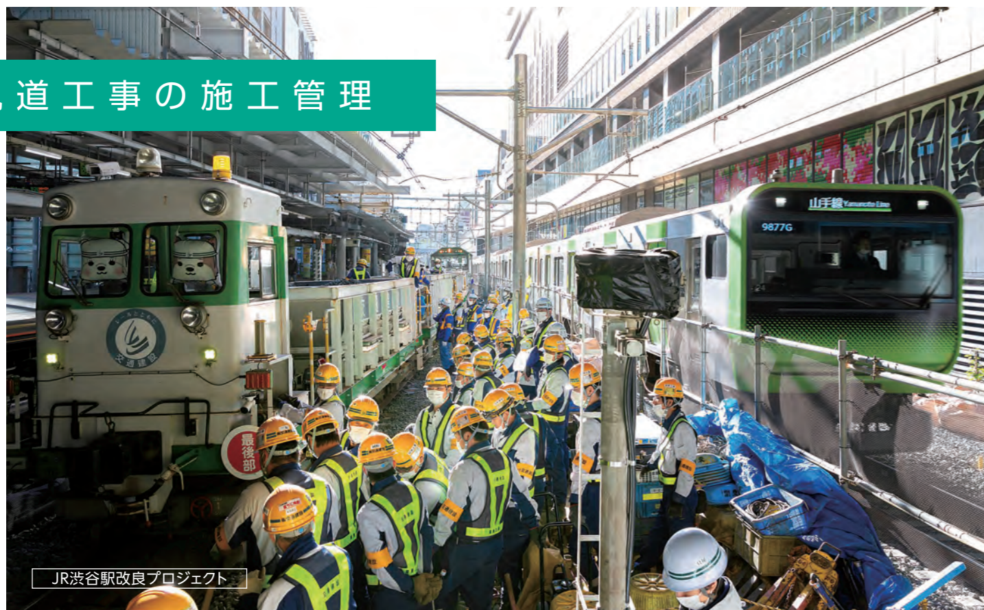
JR渋谷駅改良プロジェクト