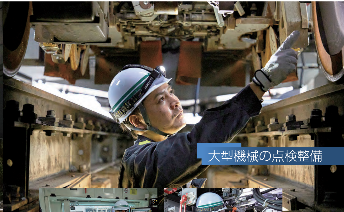
大型機械の点検整備